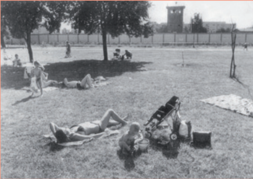
Auf dem Falkplatz in Berlin-Prenzlauer Berg fotografierten Jürgen Hohmuth nach Westen und Uwe Steinberg nach Osten. Das untere Foto fand ich in der »Neuen Berliner Illustrierten« Nr. 2/1982.